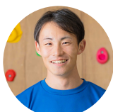
南コーチ 砺波市出身